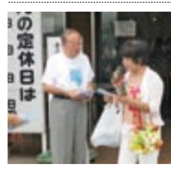
福津市内での街頭キャンペーン

問い合わせ先 宗像地区事務組合 施設課 電話 (62) 0975 宗像管工事協同組合 電話 (37) 0435