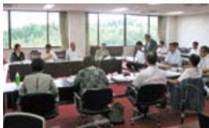
第1回審議会の様子

宗像地区事務組合の今後の水道事業計画や水道料金などに関して、提言をする宗像地区事務組合水道事業運営審議会を、宗像市・福津市内に在住する学識経験者や公募の8人で、平成22年7月に発足しました。