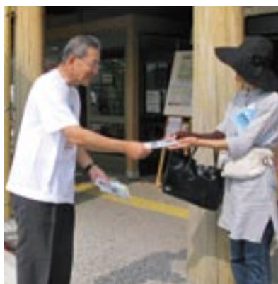
宗像市内での街頭キャンペーン

「水」を大切に 宗像地区事務組合では、8月の「水道週間」の運動の一環として、水の大切さをテーマに街頭キャンペーンを実施します。