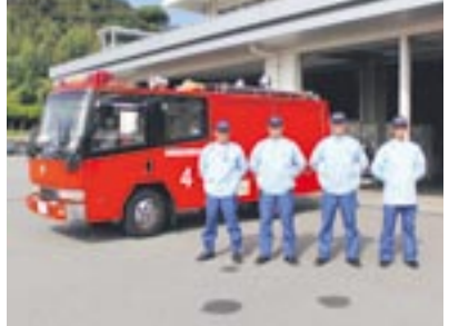
救急出動する消防隊

増え続ける救急件数の中、最寄りの救急車が出動中に救急要請があると、別の救急車が到着するまでに時間がかかり、また、事故の内容によっては救急隊だけの活動が困難な場合があります。