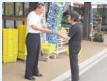
街頭キャンペーンの様子

8月1～2日の2日間、宗像市・福津市で、水資源への理解と有効利用を呼び掛ける街頭キャンペーンを行いました。