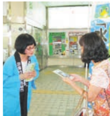
〔JR赤間駅〕伊豆副組合長（宗像市長）